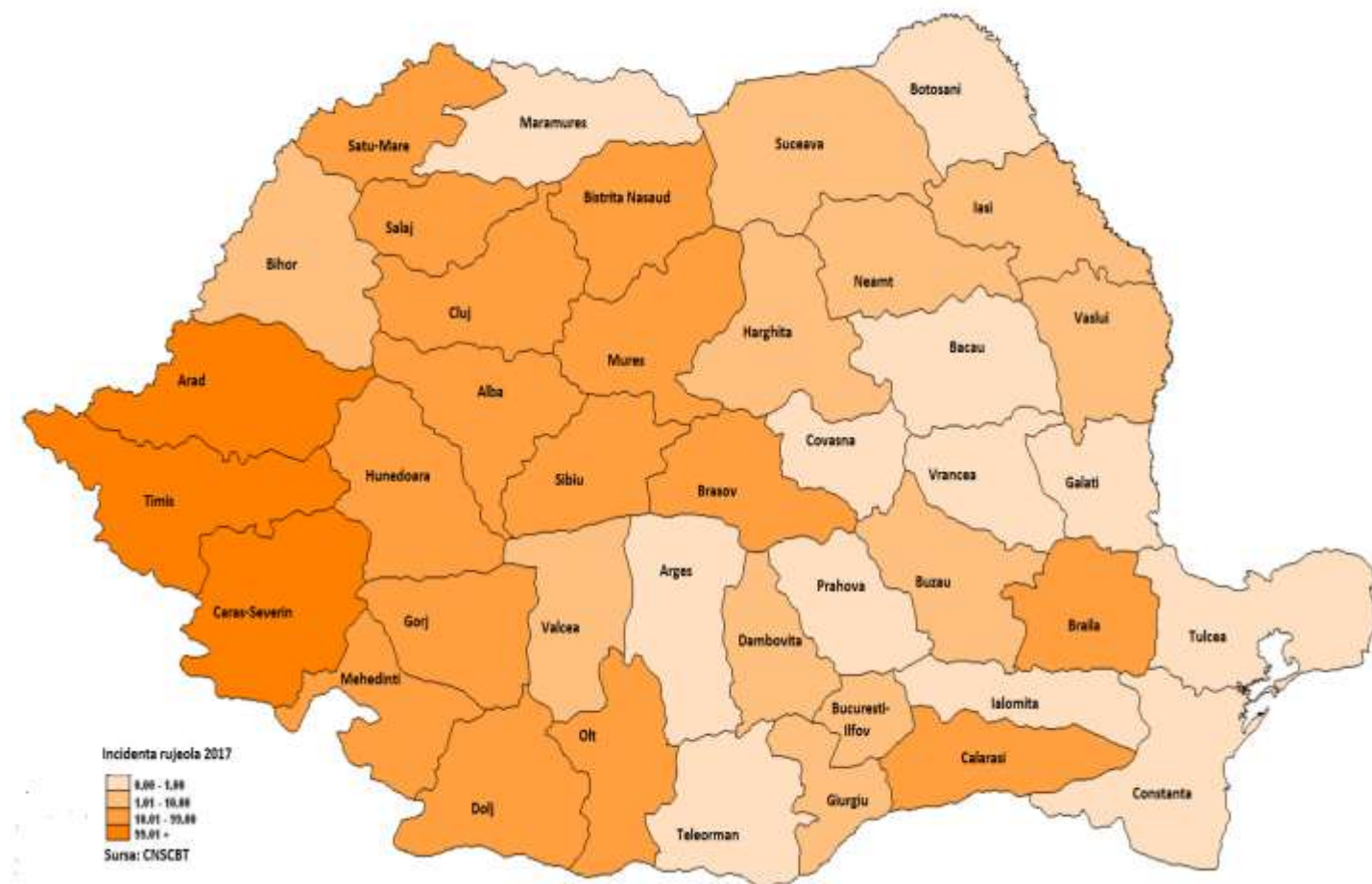
Distributia geografica a incidentei rujeolei – Romania, 2016-2017

Distributia geografica a incidentei rujeolei in perioada mentionata este prezentata in figura de mai jos: